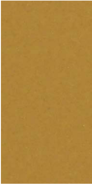
YY217E Gold Pearl