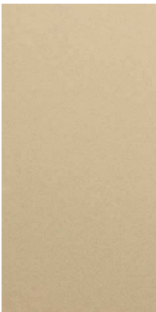
YW255F Golden Beach