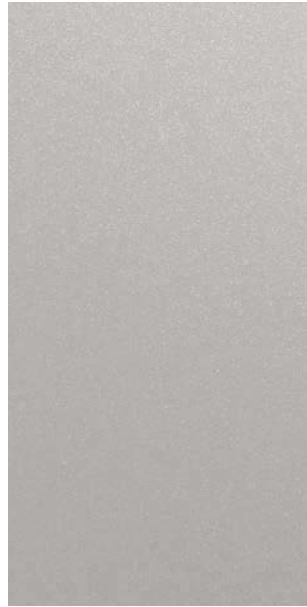
YW201E Anodic Ice