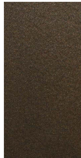
Y2214F Anodic Bronze