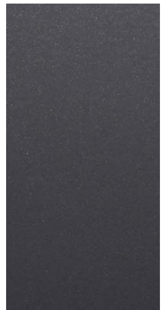
Y2215F Steel Blue Gray 715