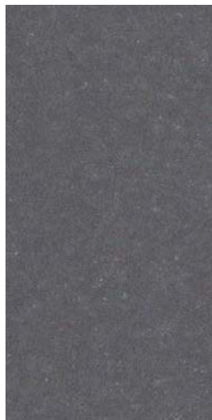
YX214E Steel Blue Gray 713